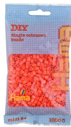
Bügelperlen midi, im Beutel - orange