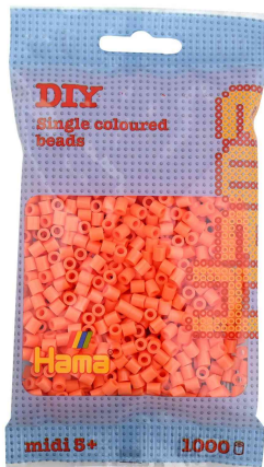
Bügelperlen midi, im Beutel - apricot

ACHTUNG! Nicht geeignet für Kinder unter 36 Monaten, wegen verschluckbarer Kleinteile.