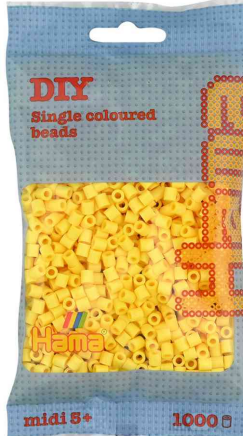
Bügelperlen midi, im Beutel - hellgelb