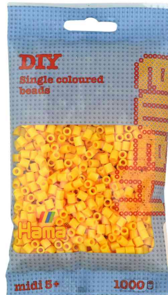
Bügelperlen midi, im Beutel - gelb