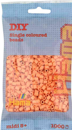
Bügelperlen midi, im Beutel - helles apricot