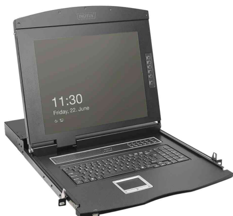
Console modulaire KVM 19" HD LCD