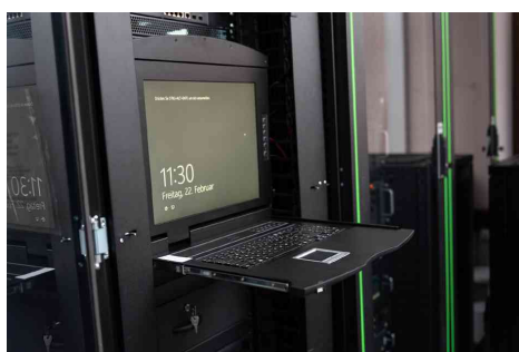
Visuel de référence : montre le produit en utilisation