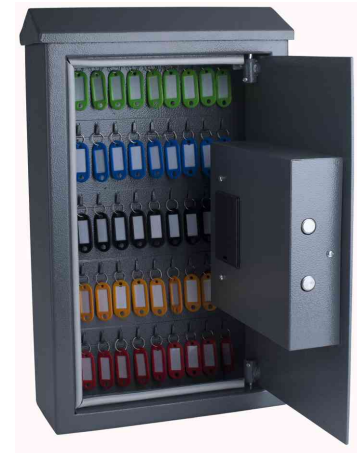
Schlüsselschrank High Security OUTDOOR, offen