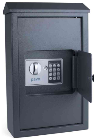
Detailansicht: zeigt die Schlossabdeckung