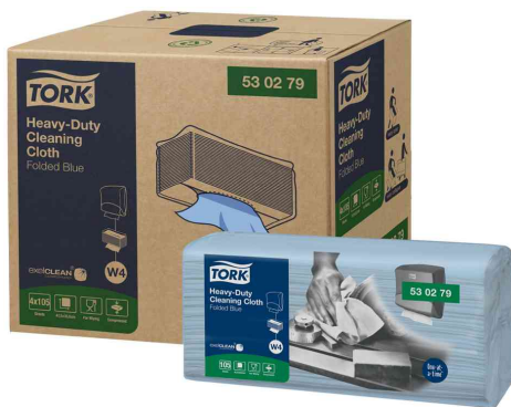
Allzweck-Reinigungstücher, Premium - extra stark