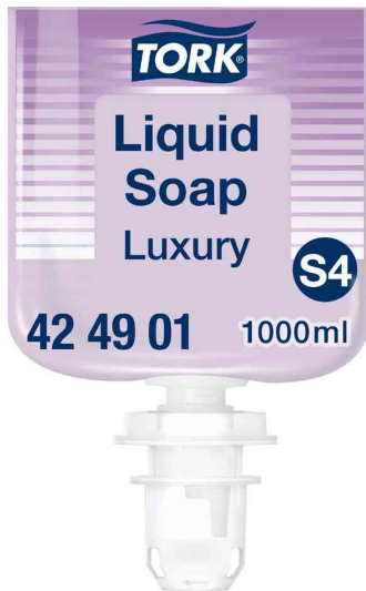
Flüssigseife, mit Jasminduft