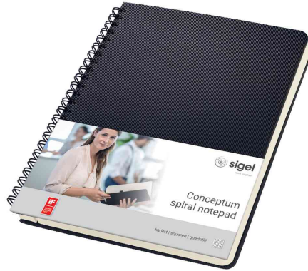
Collegeblock Conceptum, DIN A5