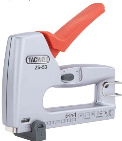
Tacker & Nageltacker Z5-140 (5-in-1)