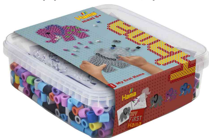
Bügelperlen maxi + Stiftplatte "Elefant", in Box

ACHTUNG! Nicht geeignet für Kinder unter 36 Monaten, wegen verschluckbarer Kleinteile.