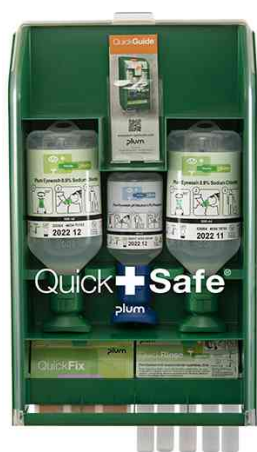
Erste-Hilfe-Station QUICKSAFE BASIC, grün