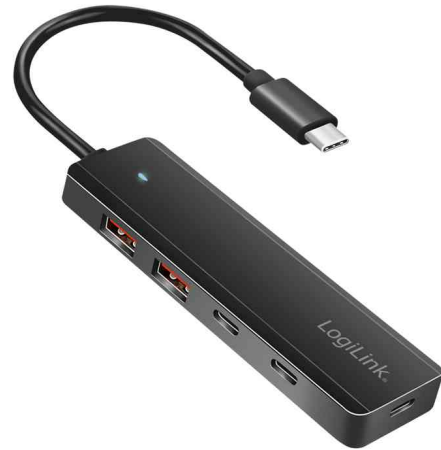
USB 3.2 Ultra-Slim-Hub, 4 Port