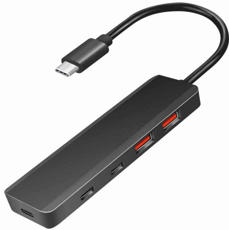
USB 3.2 Ultra-Slim-Hub, 4 Port