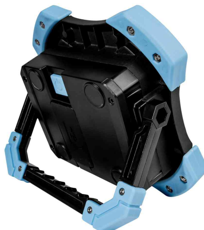
LED Akku-Arbeitsstrahler WORKING LIGHT