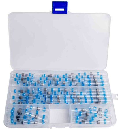
Lötverbinder-Set mit Schrumpfschlauch, 120-teilig