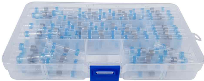
Lötverbinder-Set mit Schrumpfschlauch, 120-teilig