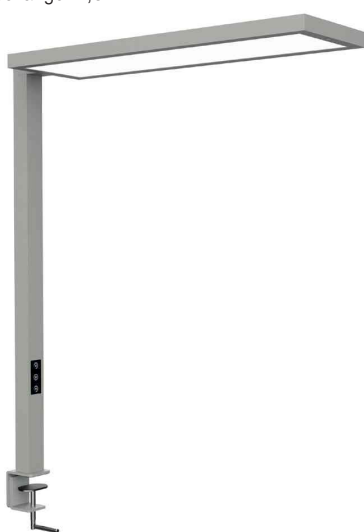
LED-Tischaufbauleuchte MAULsenja, silber