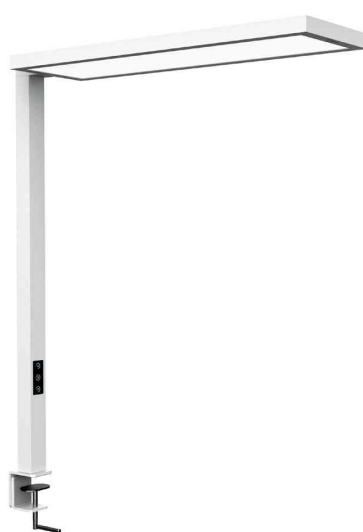
LED-Tischaufbauleuchte MAULsenja, weiß