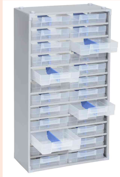
Kleinteilemagazin "VarioPlus Pro >M< 57/48"