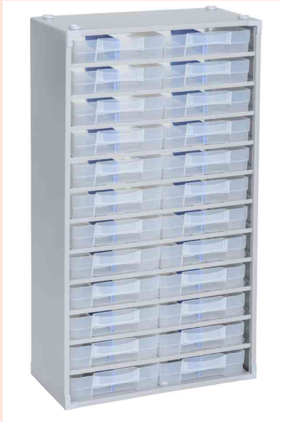
Kleinteilemagazin "VarioPlus Pro >M< 57/48"

- für den vielseitigen Einsatz in Industrie, Handwerk und Haushalt