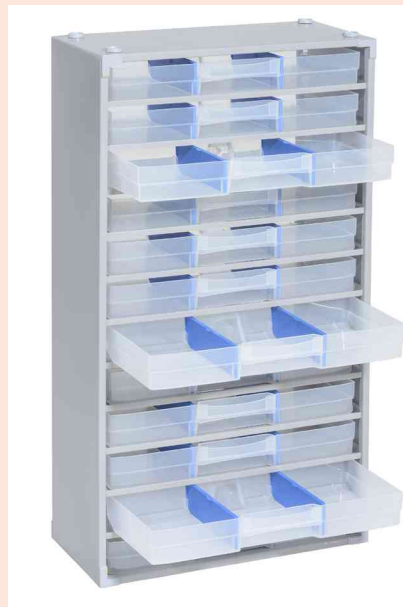
Kleinteilemagazin "VarioPlus Pro >M< 57/36"