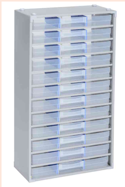
Kleinteilemagazin "VarioPlus Pro >M< 57/36"

- für den vielseitigen Einsatz in Industrie, Handwerk und Haushalt