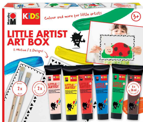
Art Box LITTLE ARTIST

- speziell entwickelt für Kinder ab 3 Jahren