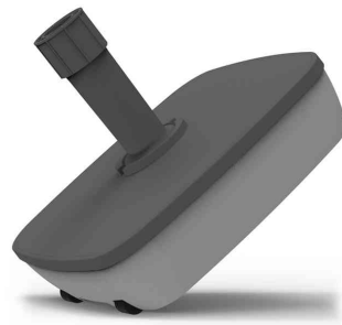
Detailansicht: Rollen für den mobilen Einsatz