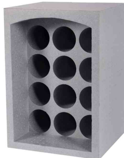
Flaschenregal, für 12 Flaschen