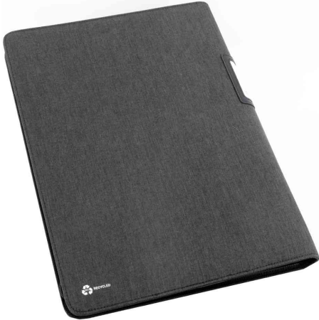
Schlüsselmappe RPET LUZON