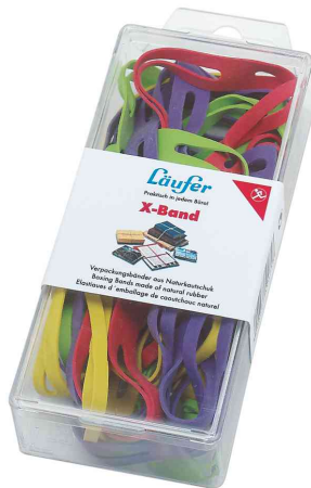
X-Bänder, in Dose