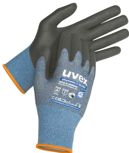
Schnittschutz-Handschuh phynomic C XG ESD