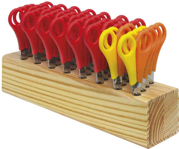
Scherenblock aus Holz, bestückt

bestückt: inkl. 32 Scheren (6x orange-gelb für Rechtshänder / 26x rot für Linkshänder) mit 5 cm-Skala auf der Klinge, mit Kunststoffgriffen