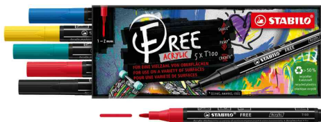
Acrylmarker FREE T100, 5er Set "Royal"