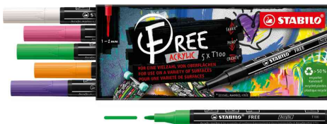
Acrylmarker FREE T100, 5er Set "Spring"