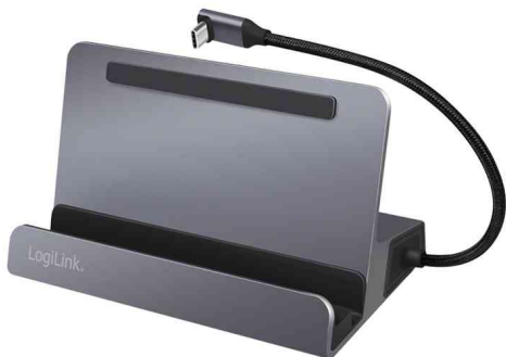
USB 3.2 (Gen 1) Docking Station mit Halterung, 6-Port

- ermöglicht das spiegeln oder erweitern des Notebook-Bildschirms