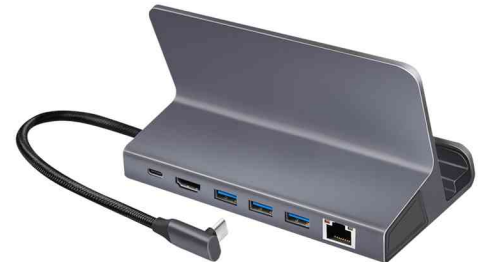
USB 3.2 (Gen 1) Docking Station mit Halterung, 6-Port