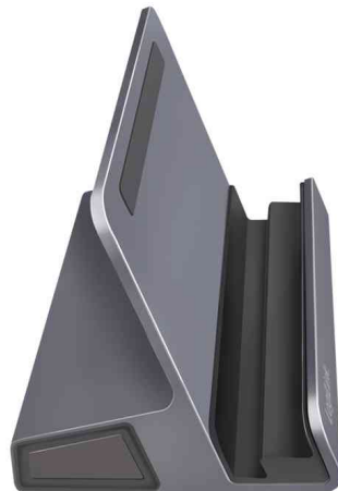
USB 3.2 (Gen 1) Docking Station mit Halterung, 6-Port