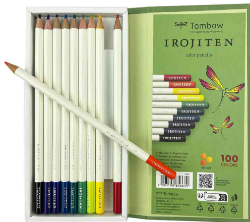
Buntstifte IROJITEN "Volumen 2", 10er Set