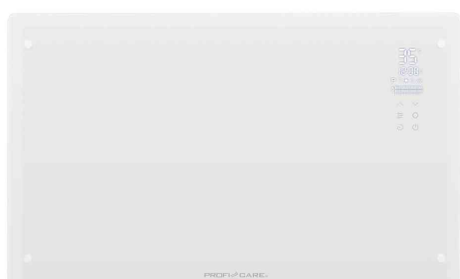
Glas-Konvektorheizung PC-GKH 3119, weiß