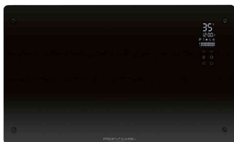
Glas-Konvektorheizung PC-GKH 3119, schwarz