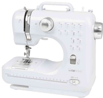
Nähmaschine NM 3795