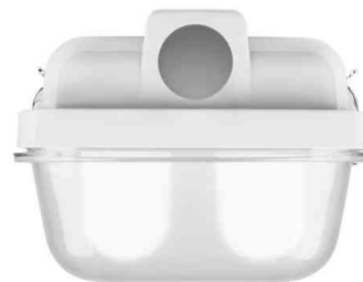
Ausführung für 2 T8 LED-Lampen