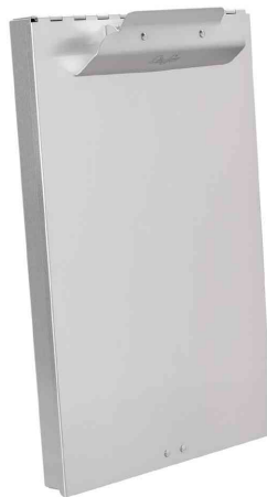
Formularhalter mit Box