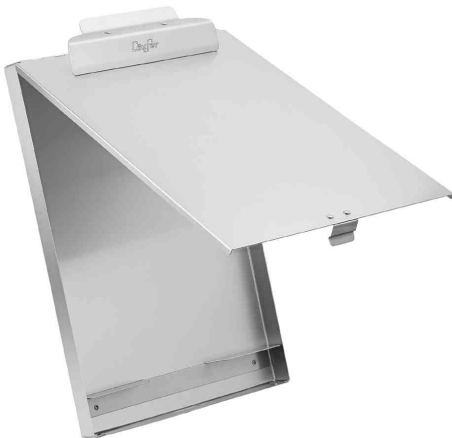
Formularhalter mit Box