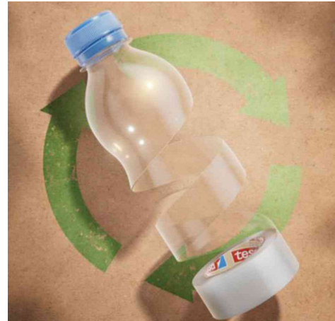
hergestellt aus PET-Flaschen