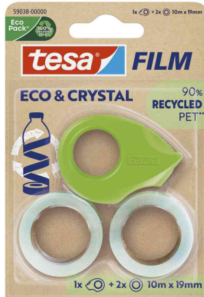
tesa Film® ECO & CRYSTAL + Abroller, Blister

- vielseitig einsetzbar für alle Standardanwendungen im Haushalt und Büro