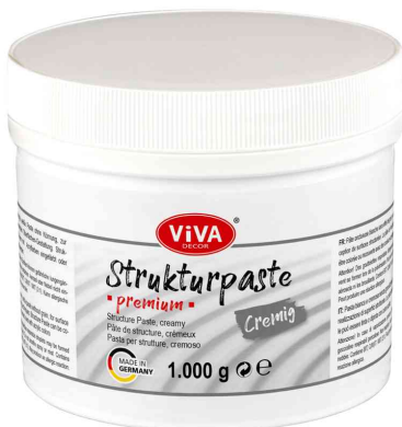
Strukturpaste PREMIUM, cremig