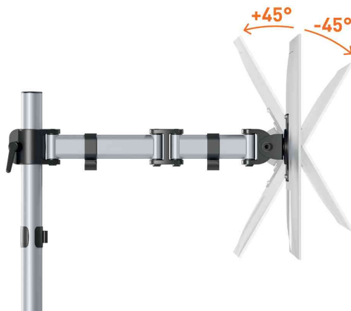
Detailansicht: 45° neigbar