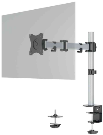
Monitorhalterung SELECT (Lieferung ohne Bildschirm)