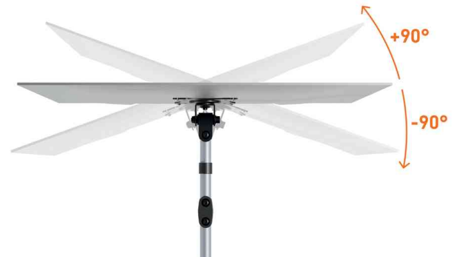
Detailansicht: 90° horizontal schwenkbar