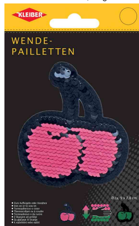
Wendepailletten Kirschen, rosa-grün