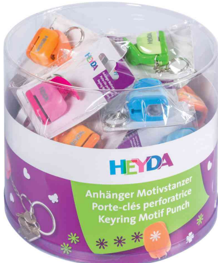
Motivstanzer Mini "Frühling", Runddose