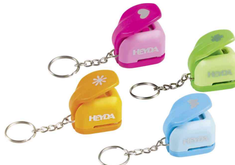
Motivstanzer Mini "Frühling"