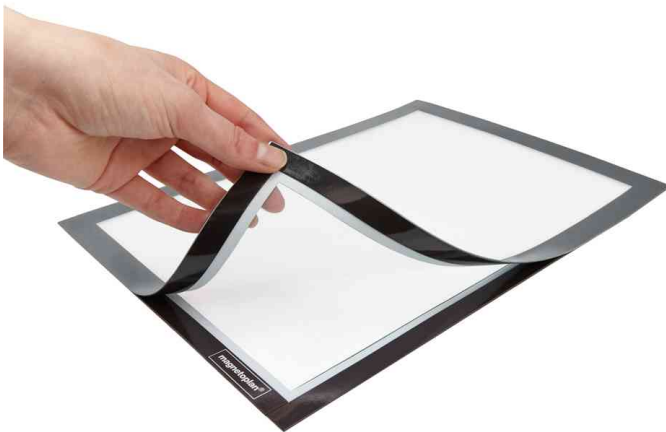
Detailansicht: aufklappbarer Magnetverschluss