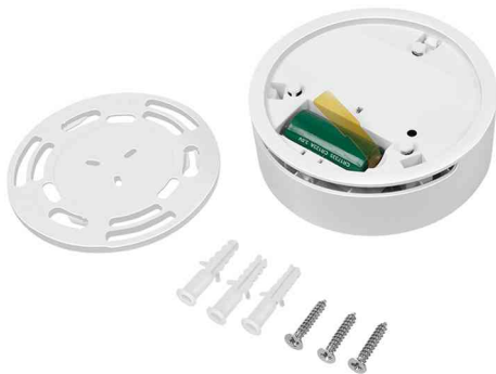
Wi-Fi Smart Rauchmelder