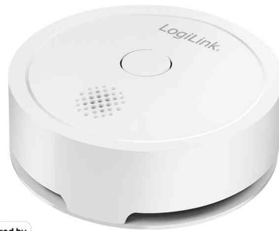
Wi-Fi Smart Rauchmelder