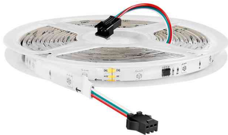
Wi-Fi Smart RGB-LED-Band