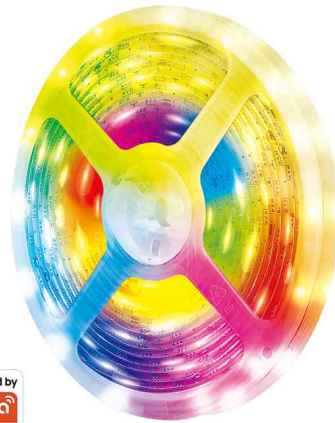
Wi-Fi Smart RGB-LED-Band