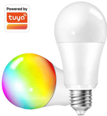
Wi-Fi Smart LED-Lampe, Sockel: E27