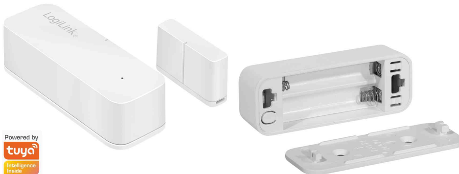
Wi-Fi Smart Tür- & Fenstersensor