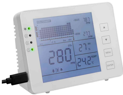
CO2-Messgerät mit Ampel