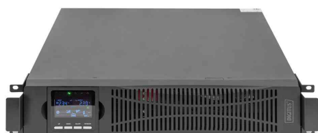
USV-Anlage OnLine mit LCD Display