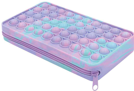
Schlamer-Etui mit Popit-Struktur