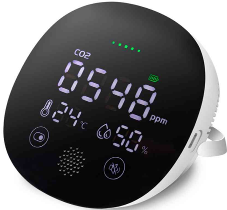
CO2-Messgerät, Temperatur- & Luftfeuchtigkeitsanzeige