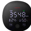
CO2-Messgerät, Temperatur- & Luftfeuchtigkeitsanzeige