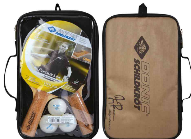
Tischtennis-Set "Persson 500", Tasche