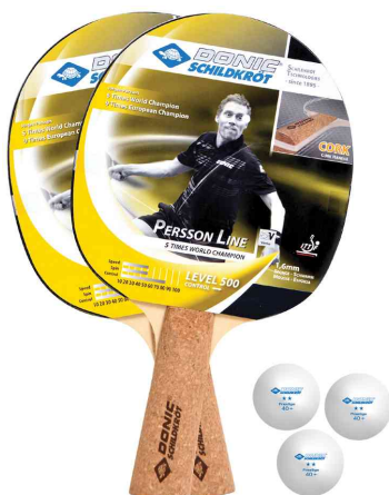
Tischtennis-Set "Persson 500", Inhalt