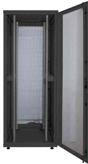
19" Serverschrank, offen