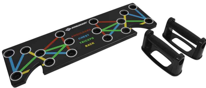
Push-Up Multi Trainer