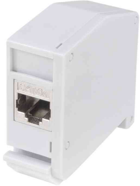
Hutschienen-Adapter mit 1 Keystone Modul