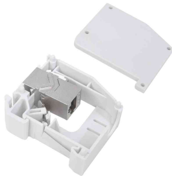
Hutschienen-Adapter mit 1 Keystone Modul