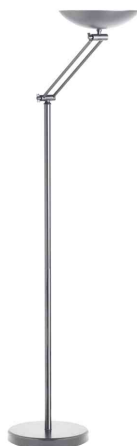
LED-Deckenfluter DELY 2.0 ARTICULATED, metallgrau