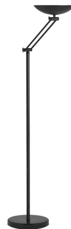
LED-Deckenfluter DELY 2.0 ARTICULATED, schwarz