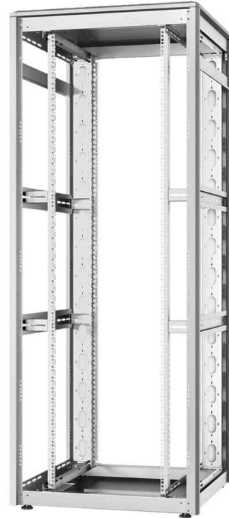
19" Netzwerkschrank Unique - offenes Gestell (Rückseite)