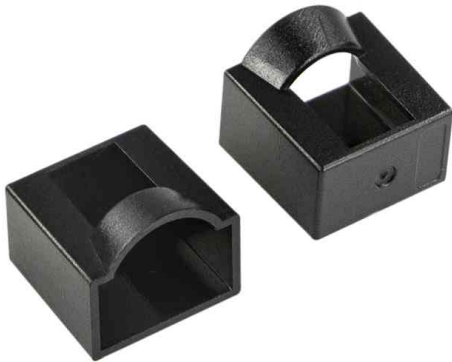
Staubschutzkappe für RJ45-Patchkabel